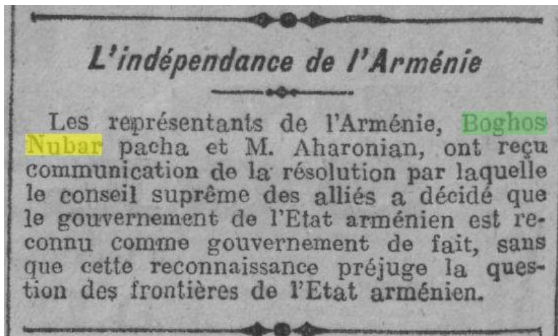
Погос Нубар Паша и Аветис Агаронян извещаются о признании Армянского государства