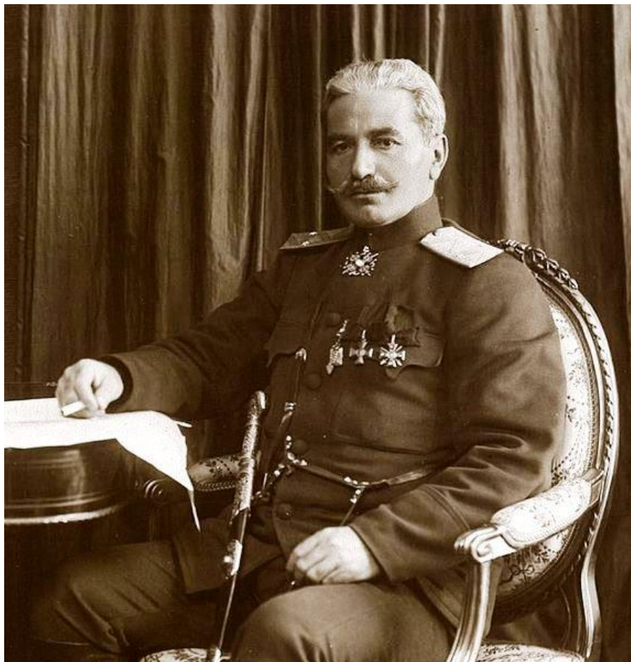
Полководец (Зоравар) Андраник