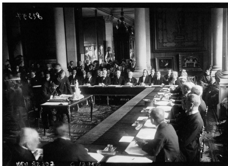
Турецкая делегация ставит свою подпись под Севрским мирным договором