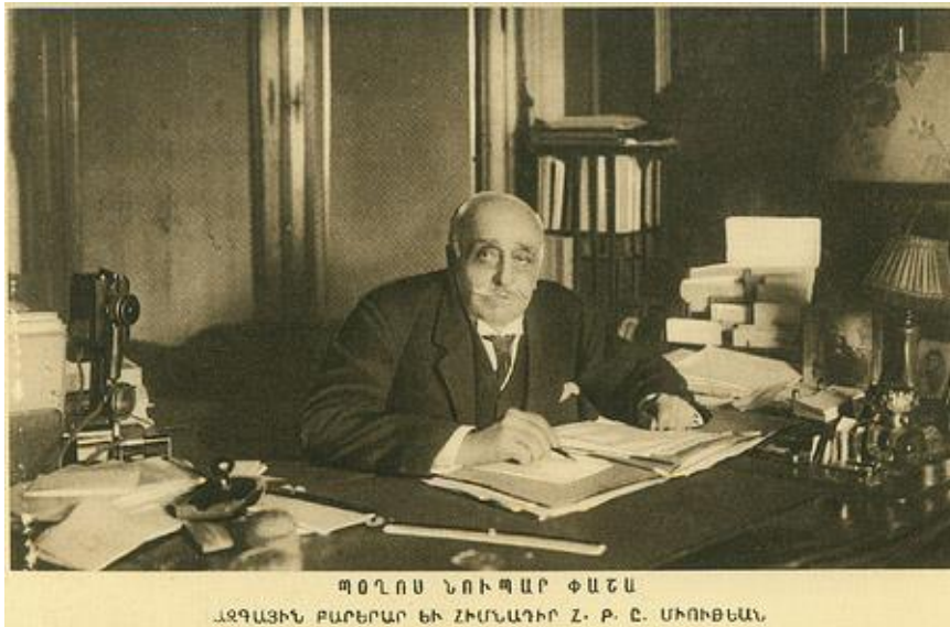
Председатель Национального Совета Западной Армении Погос Нубар Паша