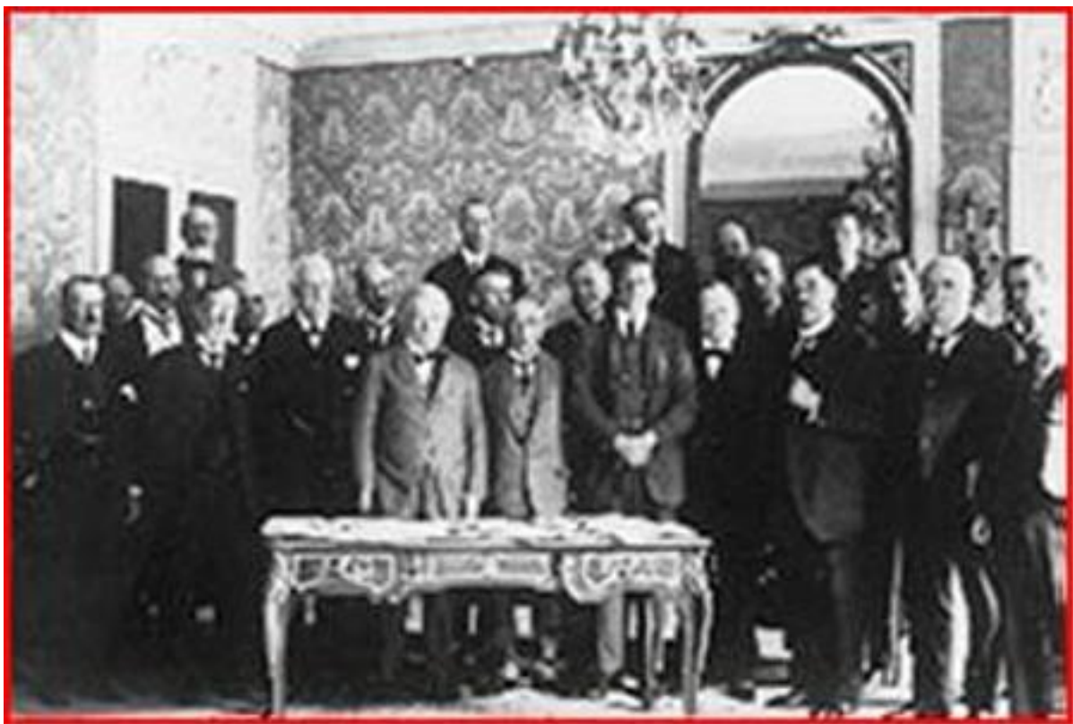
Участники Севрского мирного договора