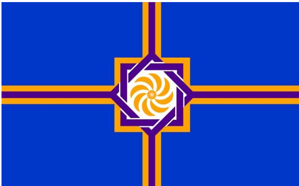
Флаг Республики Западная Армения (Армения)