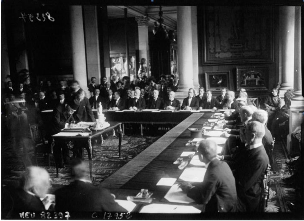
Türk delegasyonu Sevr Barış Antlaşmasının altına imza atıyor