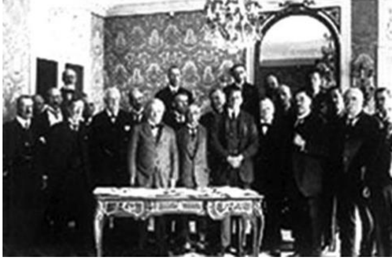
Sevr Barış Antlaşmasının katılımcıları