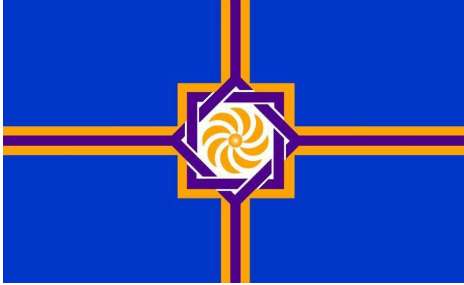
Batı Ermenistan Cumhuriyeti'nin (Ermenistan) Bayrađı