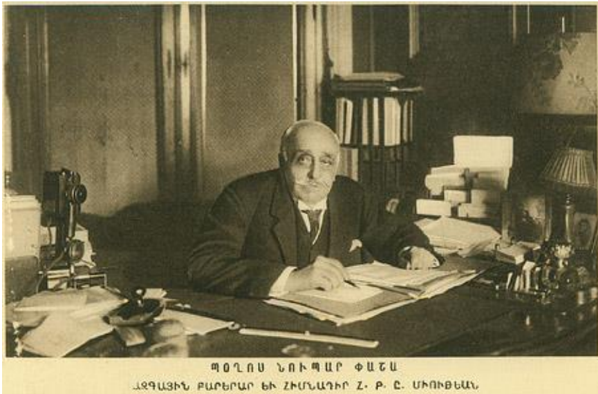
Արեւմտյան Հայաստանի Ազգային Խորհրդի Նախագահ Պողոս Նուպար Փաշա