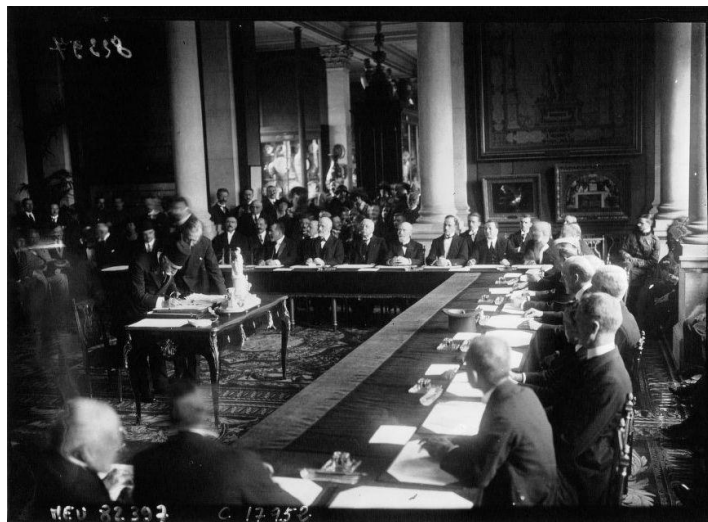
Թիւրքական պատուիրակութիւնը իր ստորագրութիւնը կը դնէ Սեւրի խաղաղութեան պայմանագրի տակ