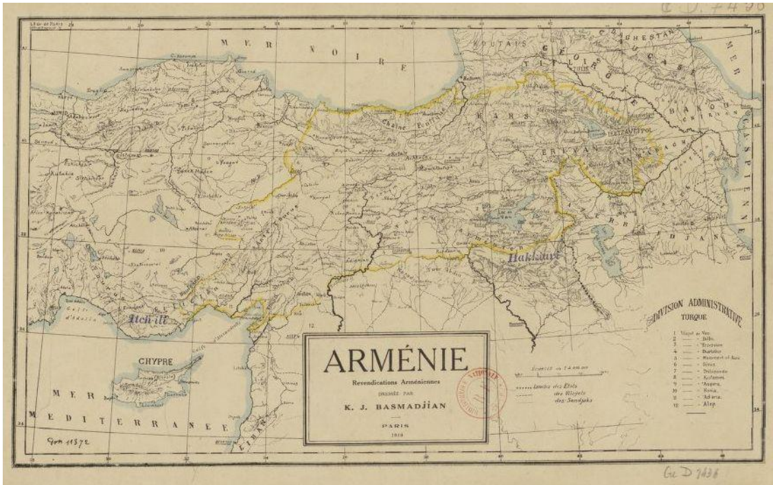
Հայաստանի ազգագրական քարտեզը