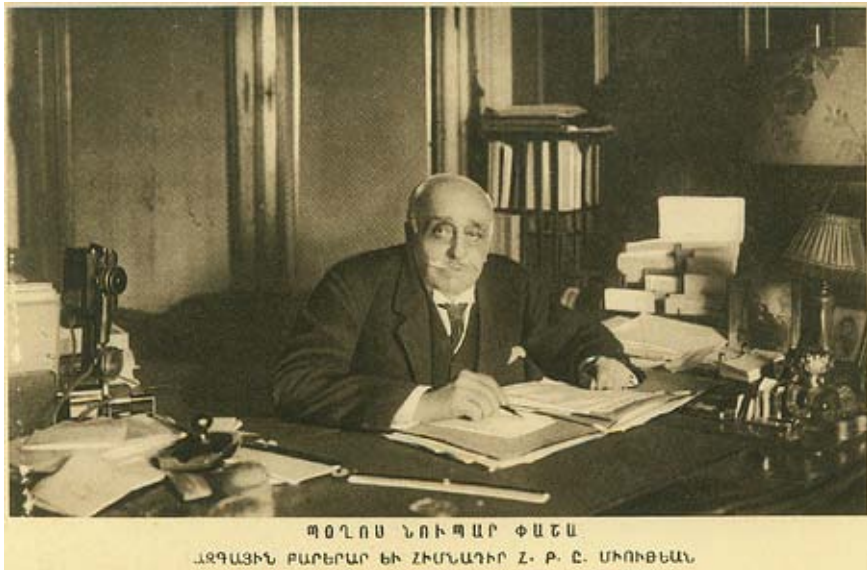
Արեւմտեան Հայաստանի Ազգային Խորհուրդի Նախագահ Պօղոս Նուպար