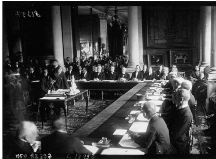
Թիւրքական պատուիրակութիւնը իր ստորագրութիւնը կը դնէ Սերի իսաղաղութեան պայմանագրի տակ